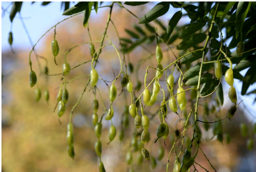
Foto: de peulen van de honingboom

Om het tweede exemplaar van de honingboom te bewonderen, loopt u verder het schelpenpad op. U loopt niet mee met de bocht naar rechts, maar u gaat rechtdoor en steekt de heuvel over. Aangekomen bij bankje op de top van de heuvel ziet u hem al staan en loopt u verder tot aan de twee dode bomen (zie foto). Door naar boven te kijken komt u vast en zeker onder de indruk van de grootte van dit exemplaar. Kijk en geniet!